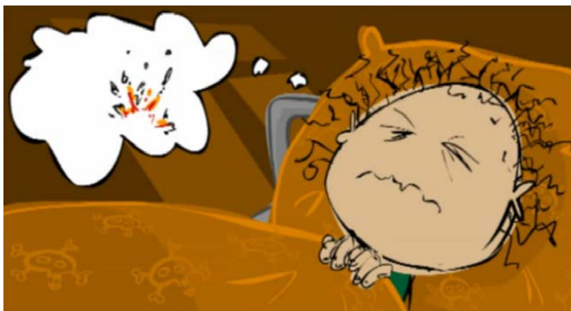
Stillbillede fra filmen 'Traumer i familien'

Diagnosen PTSD stilles til både børn og voksne. PTSD hos børn ligner den, der ses hos voksne, og omfatter ligeledes reaktioner inden for kategorierne stress, genoplevelser og undgåelsesadfærd. Symptomerne viser sig dog ofte på andre måder hos børn, afhængigt af barnets alder og udviklingstrin. Børn er særligt udsatte, og traumatiske oplevelser kan få betydning for deres emotionelle og kognitive udvikling. I det daglige arbejde med flygtningebørn er det derfor vigtigt at kunne genkende symptomer på traumer og PTSD, så der kan gribes ind med den rigtige hjælp i tide.