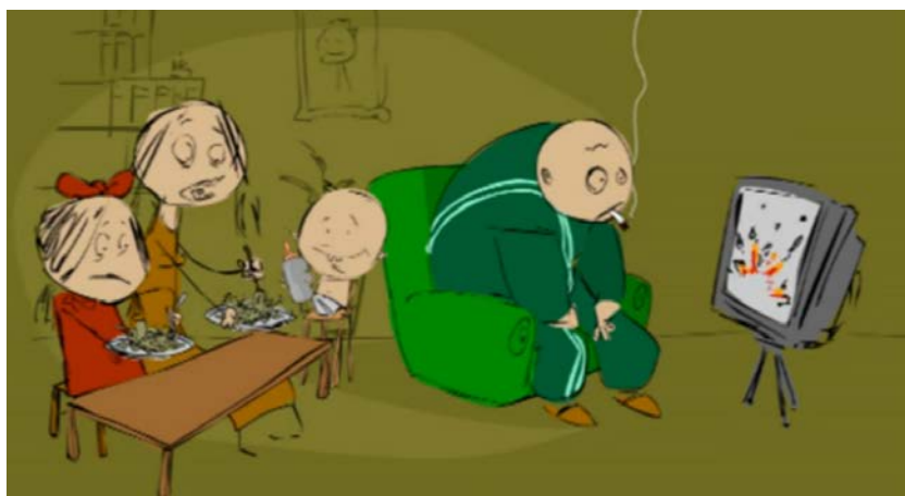
Stillbillede fra filmen 'Traumer i familien'

Børn af traumatiserede forældre kan opleve, at forældrenes traumer videregives til dem gennem forældrenes reaktioner, symptomer og manglende følelsesmæssige nærvær og opmærksomhed. Er forældrene stressede og anspændte, vil børnene ofte være nervøse og på vagt. Også forældres detaljerede beretninger om grusomme oplevelser, såsom tortur, vold og overgreb, kan påføre barnet sekundær traumatisering. Derudover vil nyhedsudsendelser fra hjemlandet præge stemningen i hjemmet og dermed påvirke både forældre og børns psykiske tilstand.